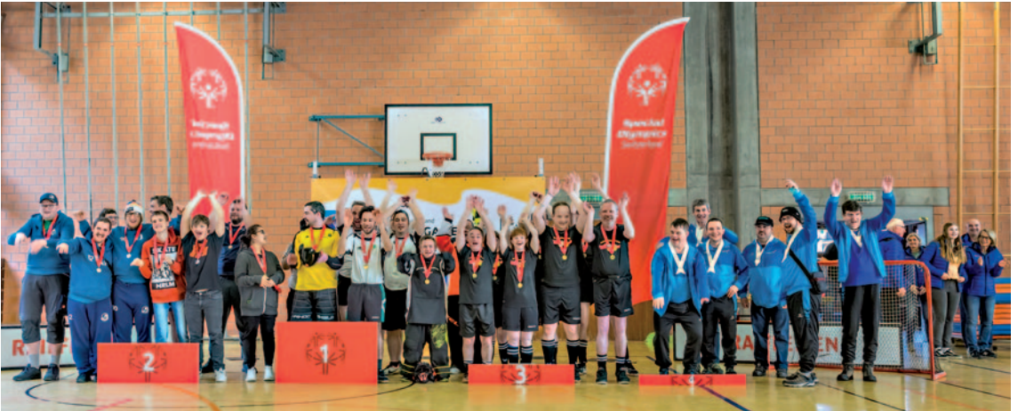
Es hat Platz für alle auf dem Podest. Mitmachen zählt mehr als gewinnen.